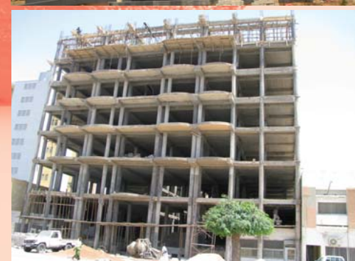
Construcción de Hotel en Mauritania en su cuarto año de estructura